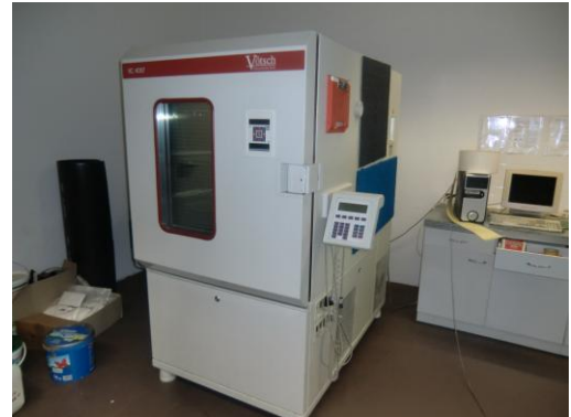
Laboraausstattung und div. Geräte zur Qualitätssicherung