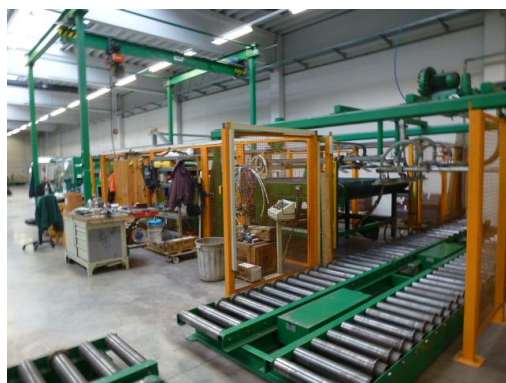
Großflächenstanzmaschine, BJ 1998