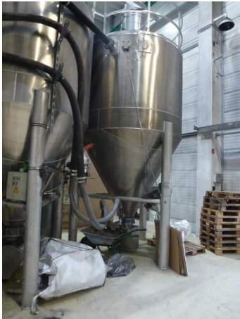
Mischanlage im Kopfbau