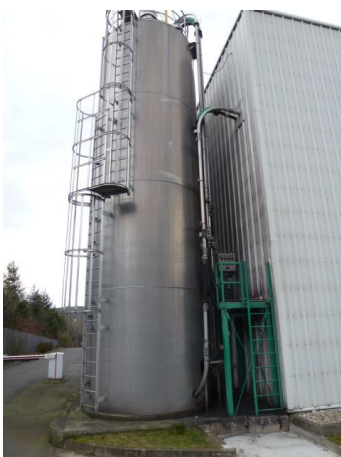
Siloanlage im Außenbereich